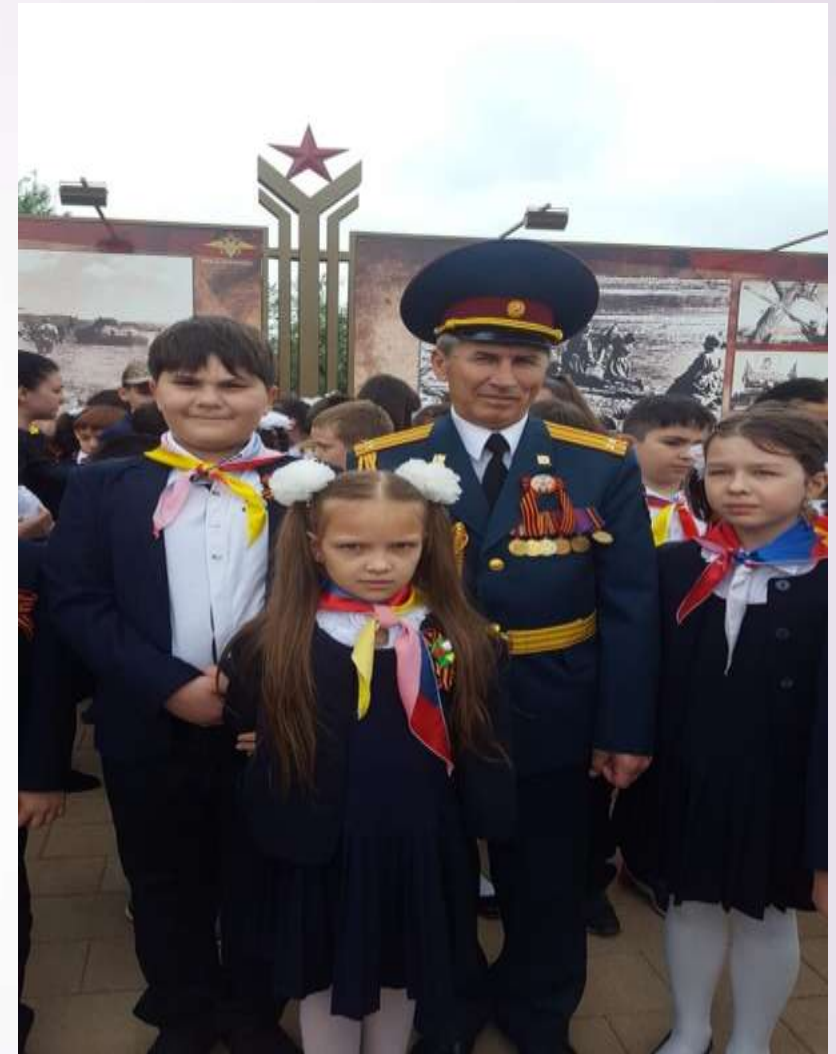
Дружина юных пожарных «Огонёк» посетили мемориальный комплекс «Барбашово поле»